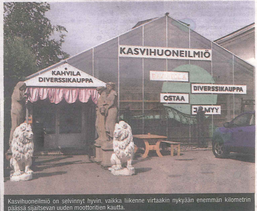
Kasvihuoneilmiö on selvinnyt hyvin, vaikka liikenne virtaakin nykyään enemmän kilometrin päässä sijaitsevan uuden moottoritien kautta.