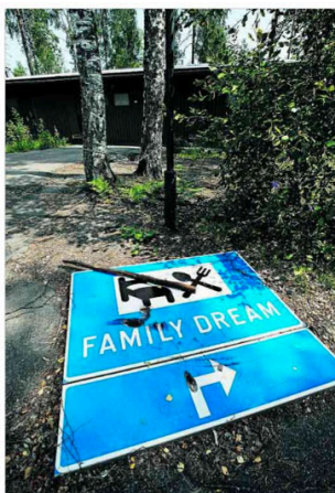
Ensin se oli Syvälampi, sitten siitä tuli Family Dream. Nyt motelli on ikävä luku vanhan Ykkösten lopettaneiden yrittäjien tilastoissa. Kiinteistö on myytävä ja opaskytki hylätty motellin sisäpihalle.