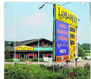
Perinteiset taukopaikat houkuttelevat asiakkaita isoja ja näyttävän mainoskytkin, mutta harva autoilija pihana ekso. Nummi-Pusulan Saukkolassa toimiva Lahjahovi on menettänyt yli puolet asiakkaistaan uuden moottorin myötä.